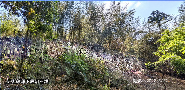
伝後藤邸下段の石垣