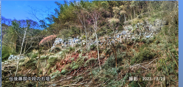
伝後藤邸中段の石垣