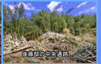
後藤邸の中央通路