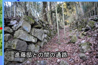
進藤邸との間の通路