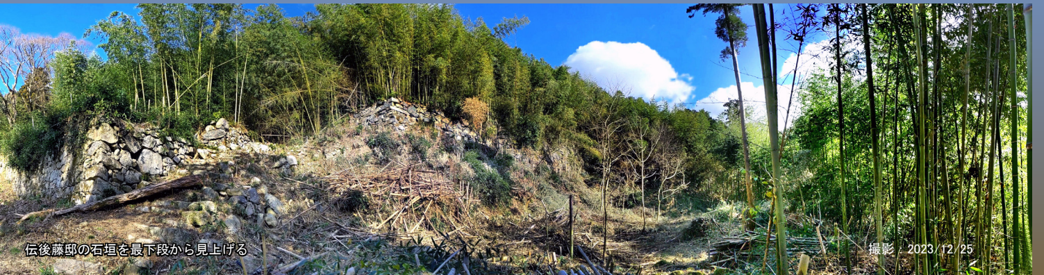
伝後藤邸の石垣を最下段から見上げる