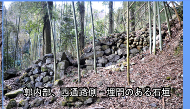
郭内部、西通路側一埋門のある石垣